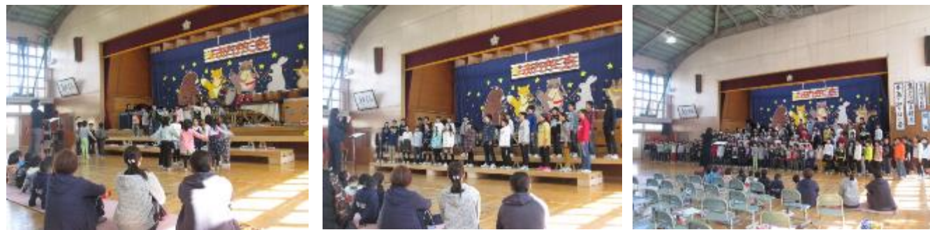
1年斉唱「わらべうたメドレー」 6年 2部合唱「『アラジン』より「ホール・全校 二部合唱 「Forever」