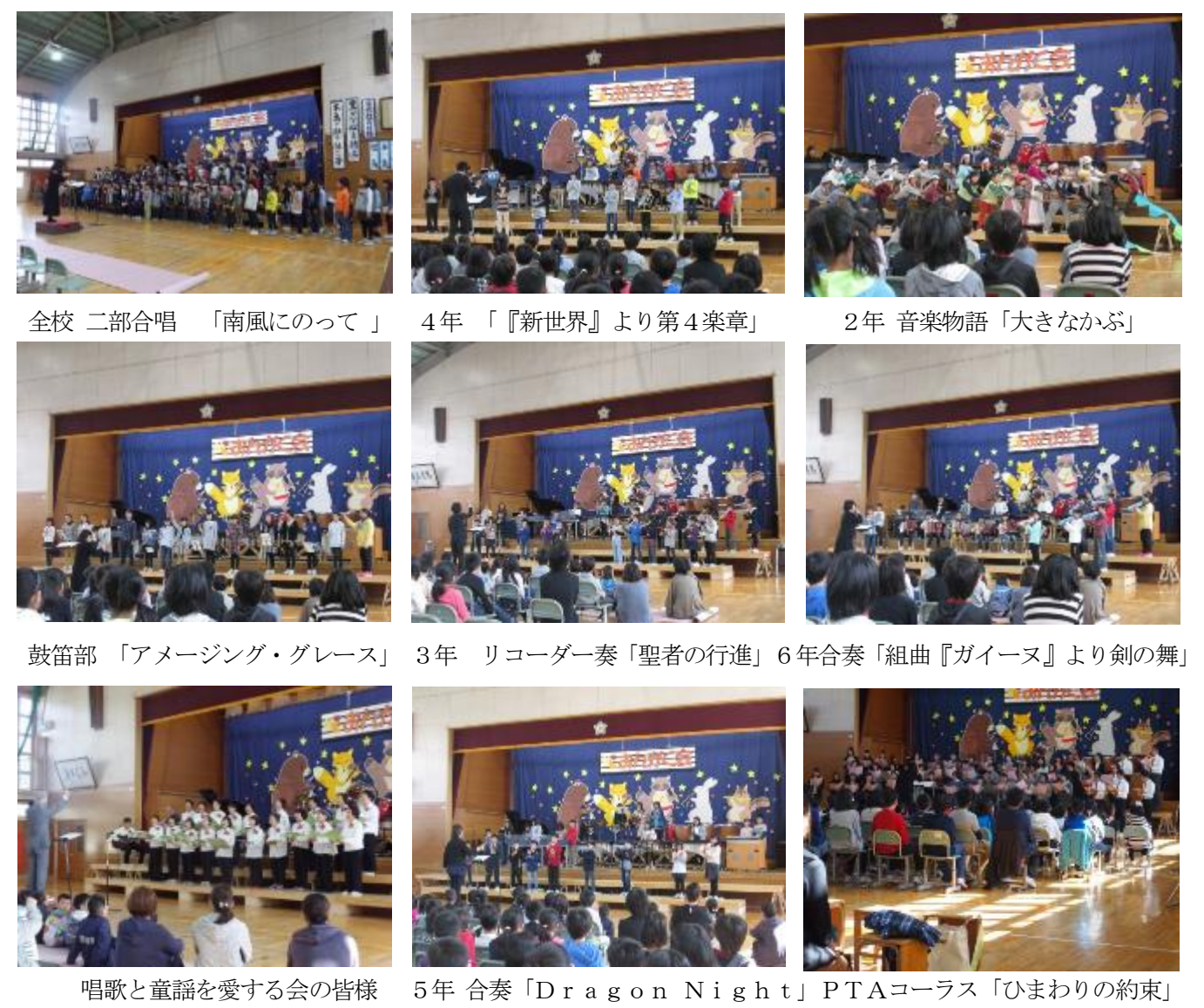
全校 二部合唱 「南風にのって」