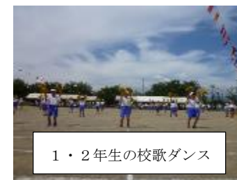
1・2年生の校歌ダンス