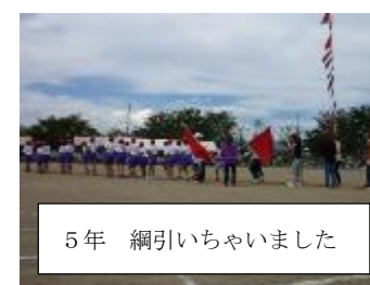
5年 綱引いちゃいました