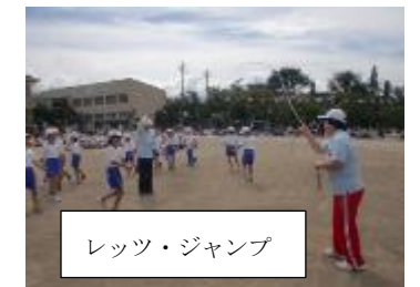
レッツ・ジャンプ