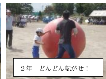
2年 どんどん転がせ!