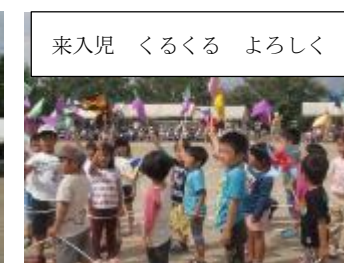
来入児 くるくる よろしく