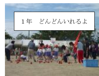
1年 どんどんいれるよ