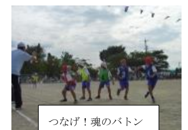
つなげ!魂のバトン