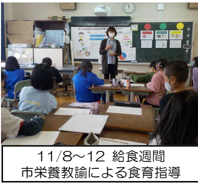
11/8～12 給食週間 市栄養教諭による食育指導