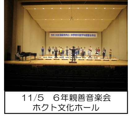
11/5 6年親善音楽会 ホクト文化ホール