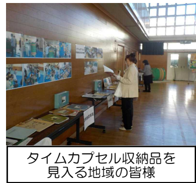
タイムカプセル収納品を見入る地域の皆様

30年前に埋設したタイムカプセルの開封式典ならびに受渡式を9月に予定し、準備を進めて参りましたが、新型コロナウイルスの感染拡大のため中止といたしました。本来であれば、当時の関係者の方々や先生方、在学生が一堂に会しての式典を開催させていただく予定でしたが願ひはかないませんでした。式典や受渡式を楽しみにしていた皆様のお気持ちを考えると非常に残念な思いがいたしました。そこで、タイムカプセル実行委員会と協議し、タイムカプセルに入っていた様々な収納品を公開し当時の様子や熱い思いを感じていただくことにしました。当日は、1・2校時に児童公開、10:30～12:00まで地域の皆様への公開、午後は参観日で来校した保護者の皆様に公開しました。30年後の未来に向けたメッセージや当時の写真、ビデオ等を見ながら懐かしく思う声を沢山聞くことができました。