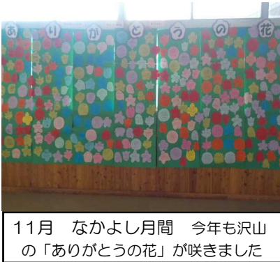
11月 なかよし月間 今年も沢山の「ありがとうの花」が咲きました