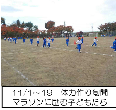
11/1～19 体力作り旬間 マラソンに励む子どもたち