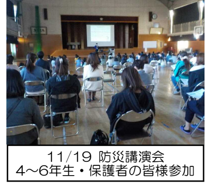
11/19 防災講演会 4～6年生・保護者の皆様参加